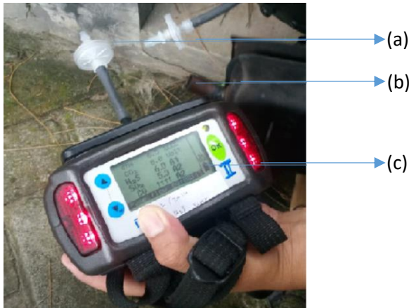
Gambar 3. Sensor gas Dragger X-am 7000 (a) selang/pipa input gas (b) sumber gas (c) layar deteksi gas beracun

Dragger X-am 7000 merupakan alat untuk mengukur kadar gas-gas Gunung Merapi secara in-situ atau kontak yaitu dengan memasukan gas masuk ke dalam tabung vakum yang terdapat pada alat tersebut. Gas-gas yang dideteksi antara lain CH 4 , CO 2 , H 2 S, SO 2 dan CO. Inilah yang menyebabkan sensor gas Dragger X-am 7000 menjadi tidak efektif untuk monitoring aktivitas vulkanik gunung berapi. Dalam pengujian awal tersebut, mesin penghasil gas dinyalakan selama 60 detik kemudian direkam nilai dari masing-masing gas yang dihasilkan. Adapun Hasil yang diperoleh, ditunjukkan pada Tabel 1 .