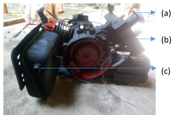
Gambar 2. Mesin 2 tak (penghasil CO 2 ) (a) pengisian bahan bakar (b) starting mesin (c) pipa keluar gas

Penelitian ini merancang sistem deteksi CO 2 dalam skala laboratorium. Sumber gas CO 2 menggunakan replika mesin 2 tak seperti pada Gambar 2. Kelebihan mesin 2 tak adalah lebih ringan, konstruksinya sederhana, dan proses konstruksi mesin yang lebih murah. Pemanfaatan proses dua langkah piston pada saat pembakaran bahan bakar dan udara di dalam ruang pembakaran, sehingga menghasilkan gas buang yang akan dideteksi. Gas yang dikeluarkan oleh mesin ini diuji dengan menggunakan sensor gas Dragger X-am 7000 seperti Gambar 3.